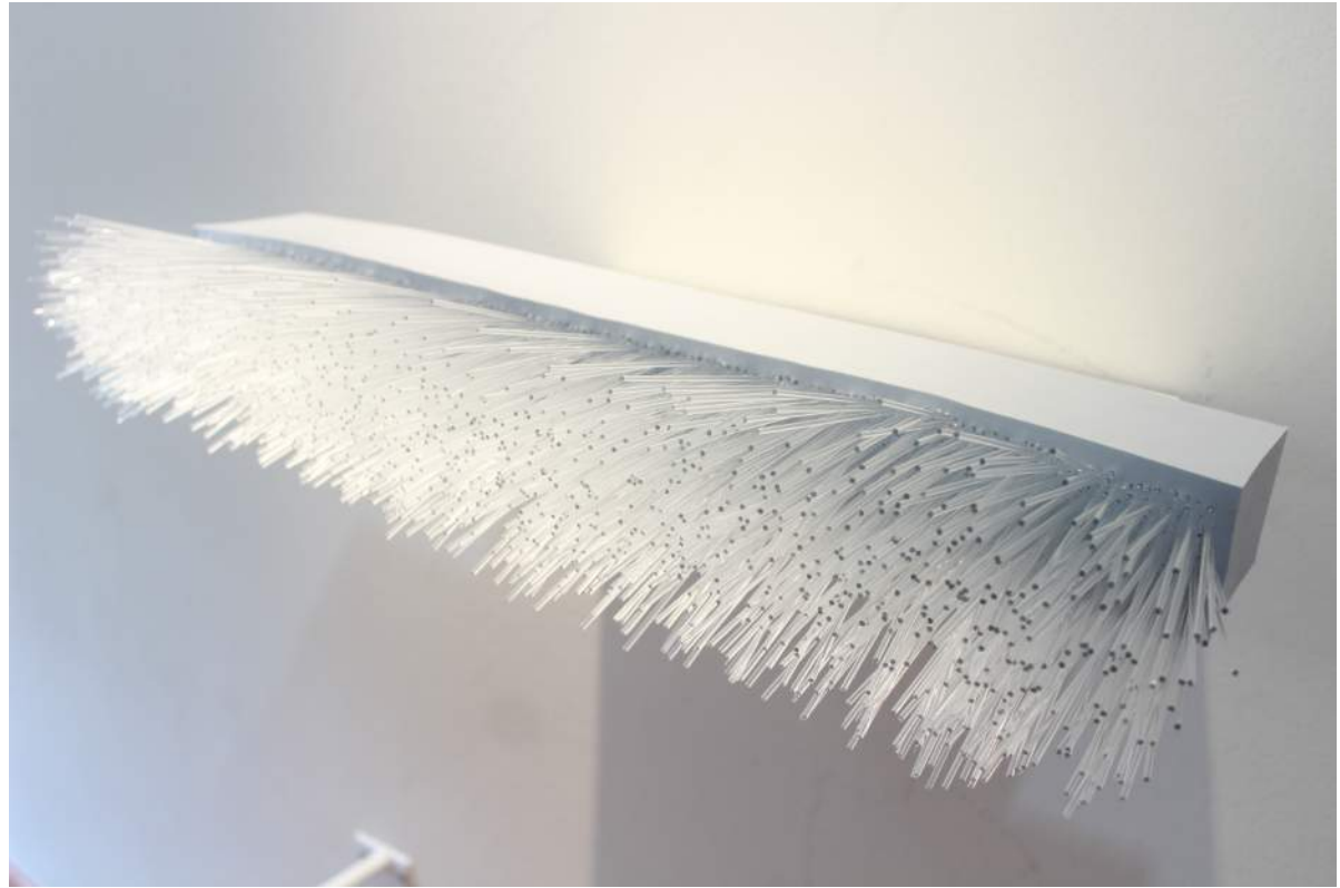
Sem Título | 2019 Elastômero e vidro / Elastomer and glass 60 x 6 x 12 cm Tiragem: 1/3 + 2 PA / Edition: 1/3 + 2 AP R$ 6.000,00