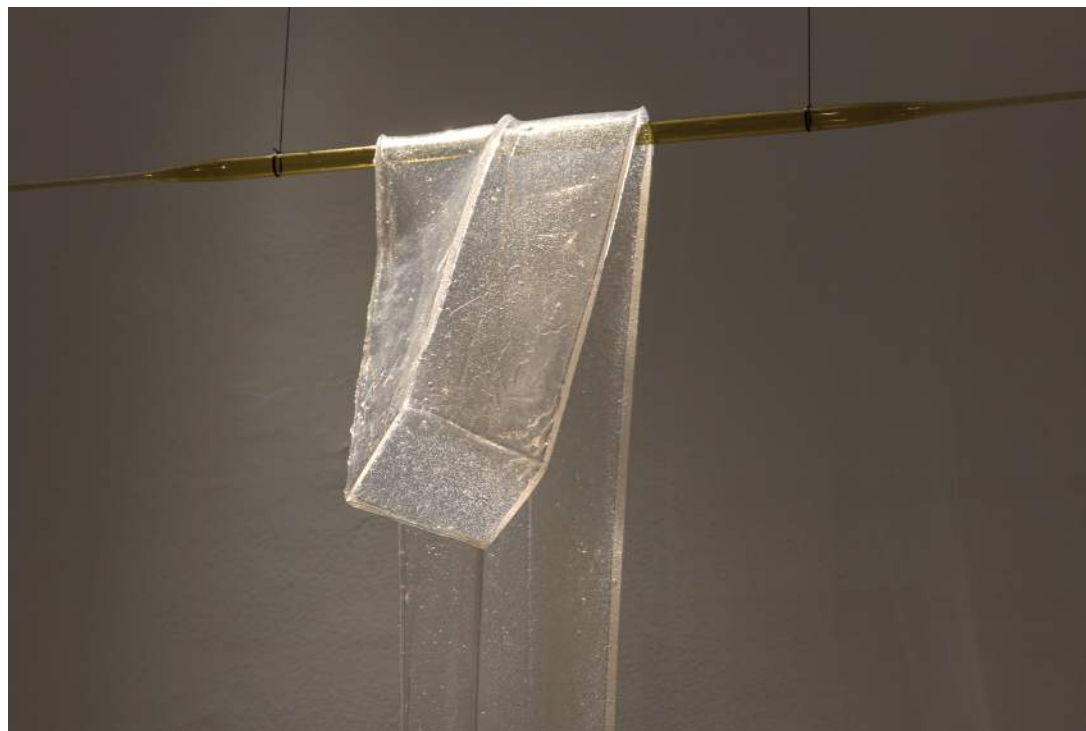
Flácida | 2018 Elastômero e vidro / Elastomer and glass 80 x 100 x 7 cm Tiragem: 1/3 + 2 PA / Edition: 1/3 + 2 AP R$ 6.500,00