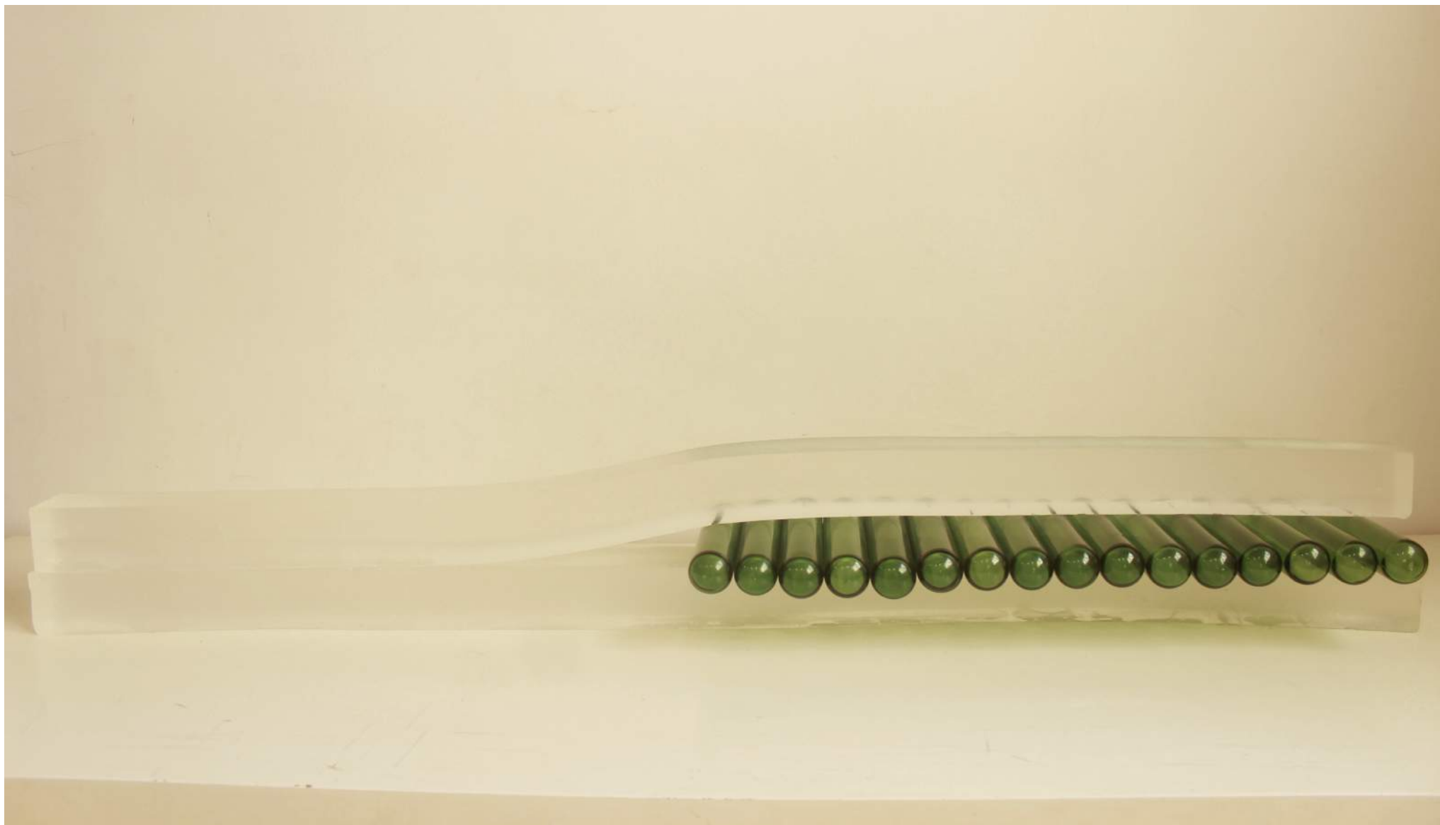
Sem Título | 2019 Elastômero e vidro / Elastomer and glass 125 x 16 x 24 cm Tiragem: 1/3 + 2 PA / Edition: 1/3 + 2 AP R$ 8.000,00