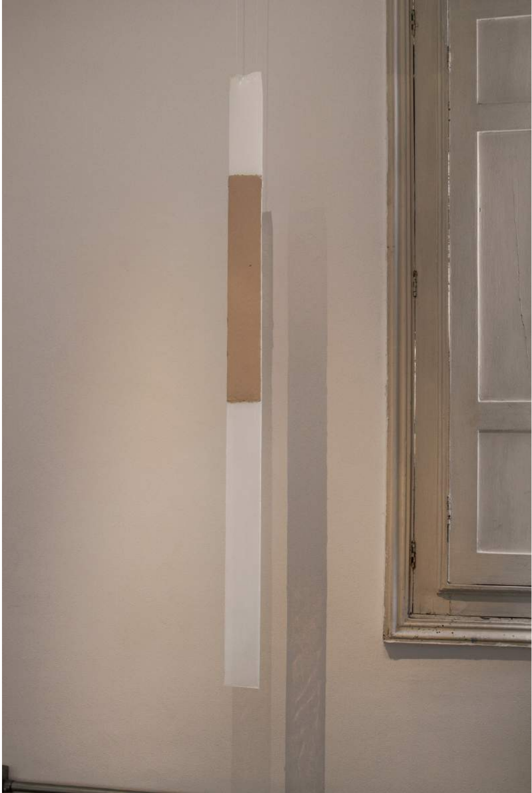
Sem Título | 2018 Elastômero / Elastomer 8 x 120 x 3 cm Tiragem: 1/3 + 2 PA/ Edition: 1/3 + 2 AP R$ 6.000,00